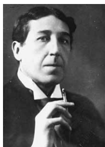
Игорь Северянин 1887-1941 г. Череповец