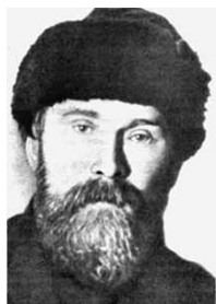
Николай Клюев 1884-1937 Вытегорский уезд