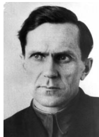
Варлам Шаламов 1907-1982, г. Вологда