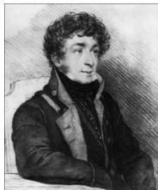
Константин Батюшков 1787-1855 г. Вологда