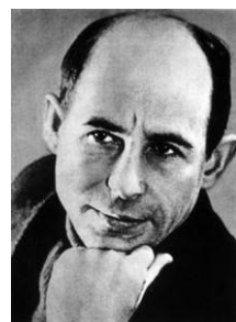
Рубцов Николай 1936-1971 с. Никольское Тотемский район