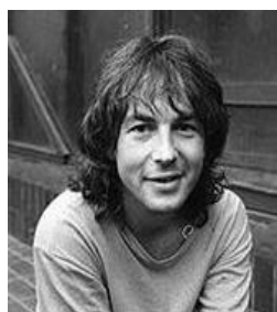
Александр Башлачев 1960-1988 г. Череповец