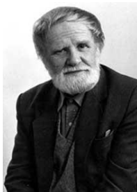
Белов Василий 1932-2012 с. Тимониха Харовский район