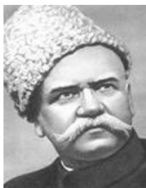
Владимир Гиляровский 1855-1935, г. Вологда