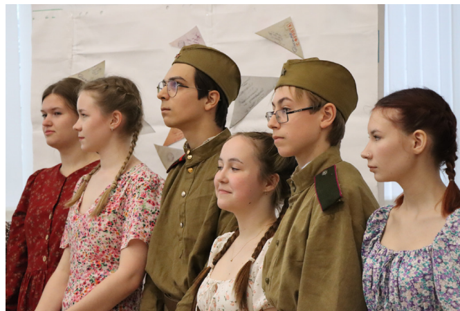
Фото 1. Театрально-музыкальная постановка «Надежда на завтра». Автор — Максим Шипаков.

В 2025 году Вологодский государственный университет стал участником областного конкурса социальных проектов среди молодежи «Мои наставники», который состоялся по инициативе Женского движения в Вологодской области при поддержке Правительства Вологодской области.