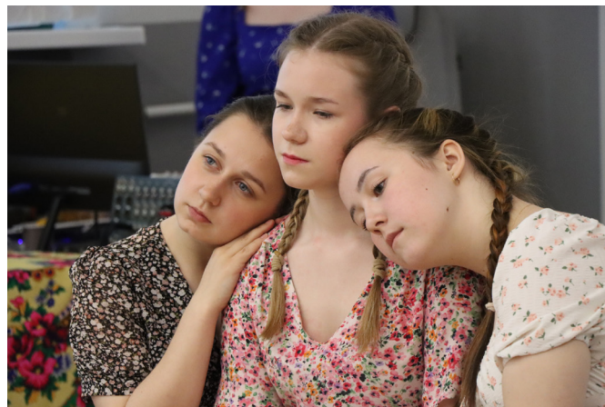
Фото 2. Театрально-музыкальная постановка «Надежда на завтра». Автор — Максим Шипаков.