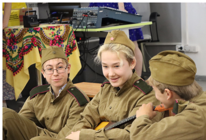
Фото 3. Театрально-музыкальная постановка «Надежда на завтра». Автор — Максим Шипаков.