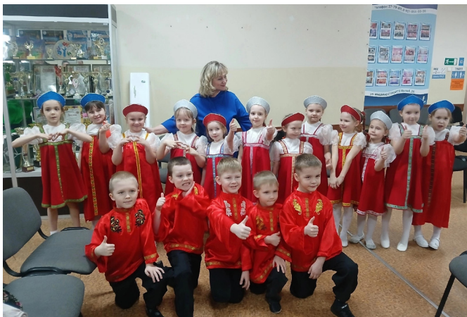
Конкурс-фестиваль «Вологодский Журавель». Номера: «Во кузнице» и «Было у матушки 12 дочерей».