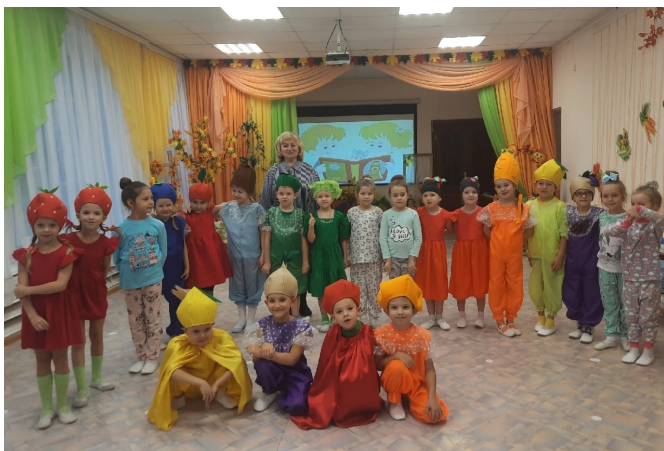
Музыкальная сказка «Добро и порядки на маленькой грядке»