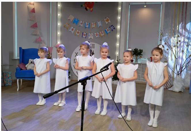
Областной конкурс-фестиваль детского творчества «Арт-Вишенка»

ственного вкуса, певческих навыков, вызывают радостные эмоции. В моей практике постоянно присутствуют постановки музыкальных спектаклей. Например «Путешествие маленького принца», «Добро и порядки на маленькой грядке», «Колобок наоборот», «Федорино горе», «Рассеянный с улицы Бассейной» и другие спектакли, где большое место заняли музыка и песни. В данных постановках практически каждый главный герой имеет свою вокальную тему, финал спектакля объединяется общим вокальным номером.