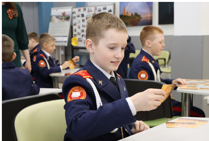
Фото 5. Мероприятие для кадет «Играем, учимся, помним».