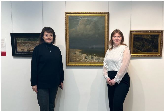
Фото 4. Проект «Герои нашей памяти».