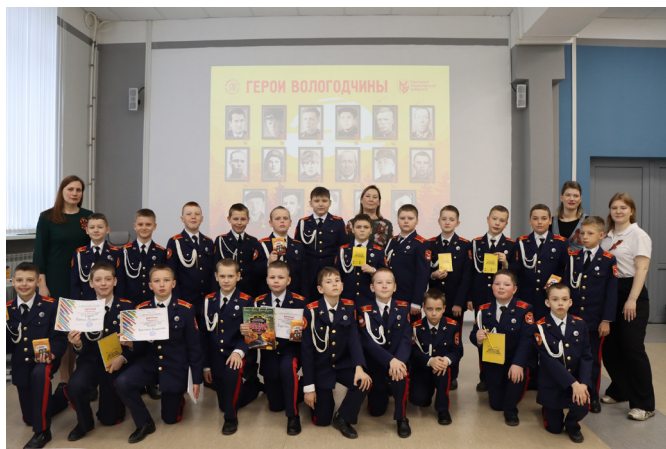
Фото 6. Мероприятие для кадет «Играем, учимся, помним».