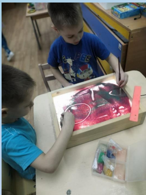
«РИСОВАНИЕ НА ПЕСКЕ»