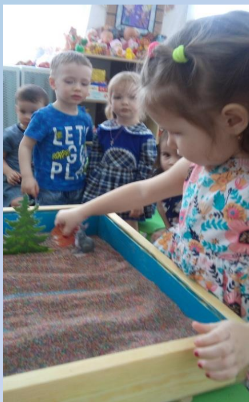
«ЖИВОТНЫЕ НАШЕГО ЛЕСА»