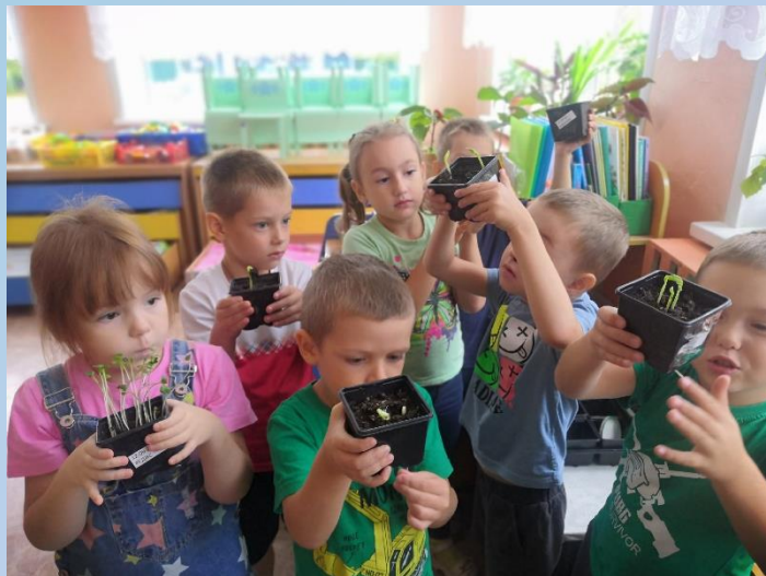
ГРАФИК ВОСПИТАТЕЛЬНОЙ РАБОТЫ 2022-2023 УЧЕБНЫЙ ГОД СКВОЗНАЯ ТЕМА «НАШИ ДЕТСКИЕ ДЕЛА, ОТКРЫТИЯ, ИССЛЕДОВАНИЯ»

УЧАСТИЕ В ДЕТСКОЙ КОНФЕРЕНЦИИ «МОИ ПЕРВЫЕ ОТКРЫТИЯ, ИССЛЕДОВАНИЯ И ПРОЕКТЫ» (АПРЕЛЬ 2023 ГОД)