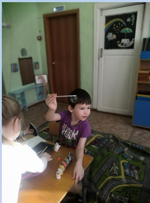
«ИЗГОТОВЛЕНИЕ МЫЛЬНЫХ ПУЗЫРЕЙ»