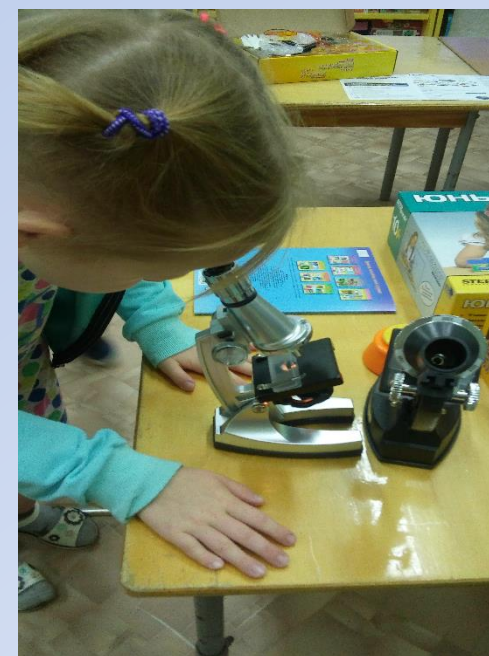
«РАБОТА С МИКРОСКОПОМ»