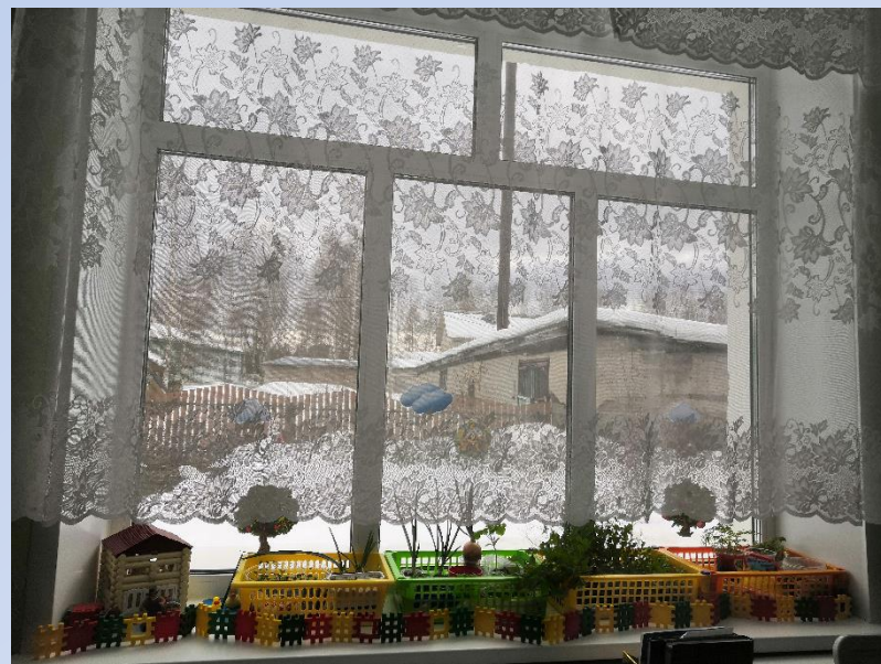
ОГОРОД НА ПОДОКОННИКЕ