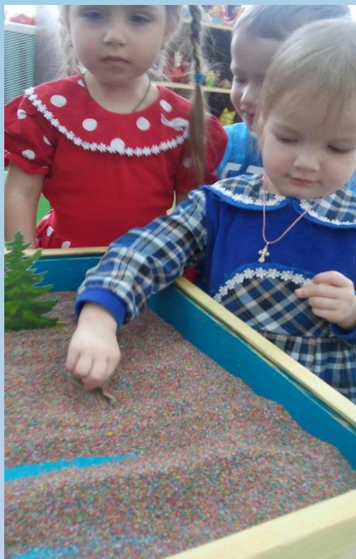
ИГРЫ С ПЕСКОМ